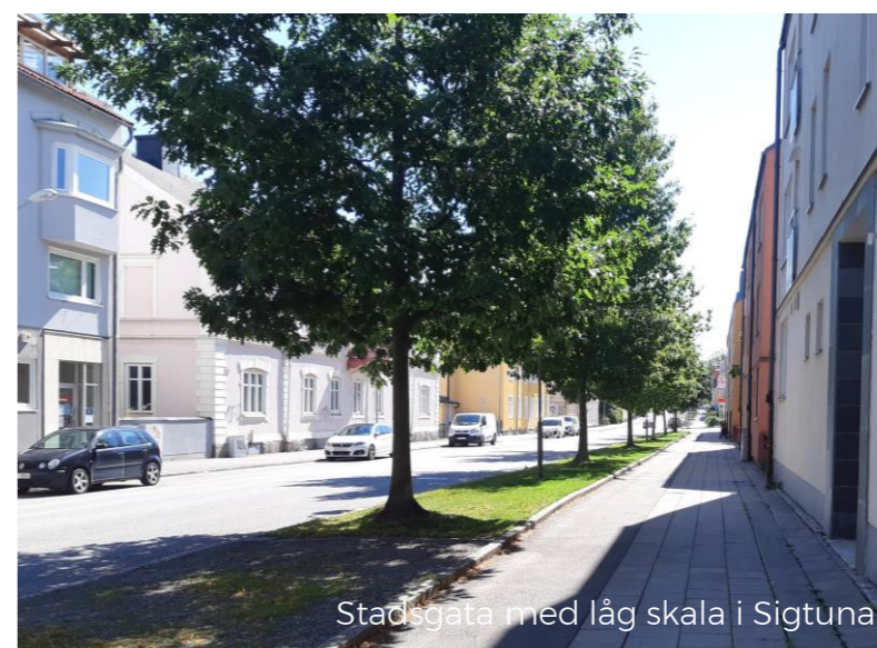
Stadsgata med låg skala i Sigtuna