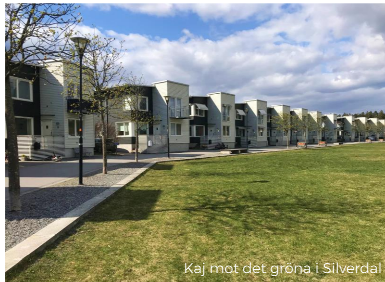
Kaj mot det gröna i Silverdal