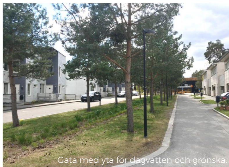
Gata med yta för dagvatten och grönska.