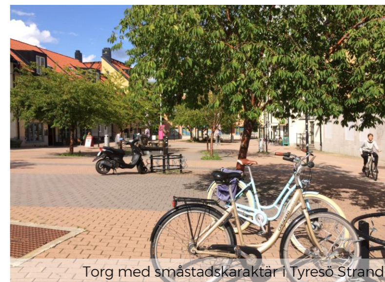
Torg med småstadskaraktär i Tyresö Strand