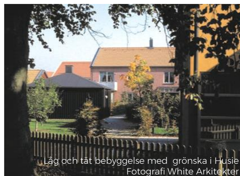
Låg och tät bebyggelse med grönska i Husie Fotografi White Arkitekter