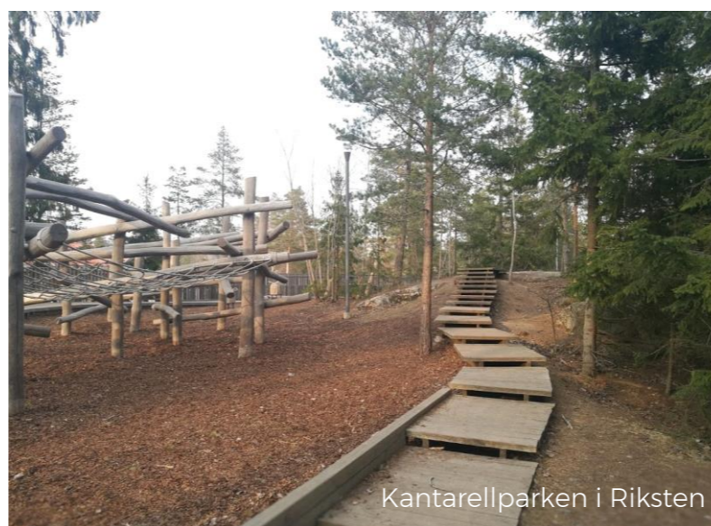
Kantarellparken i Riksten